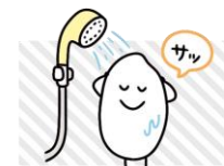
お米はサッと洗う