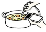
調理時の加熱の徹底(殺菌)