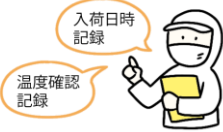
納入業者・食材の品質管理

子どもたちに安全な給食を提供するために、国のガイドラインに沿った衛生管理を行っています。各工程で、決められた内容を実施し、記録しながら作業を行うことで安全性を高めています。