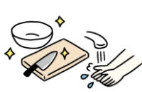
調理室での衛生管理